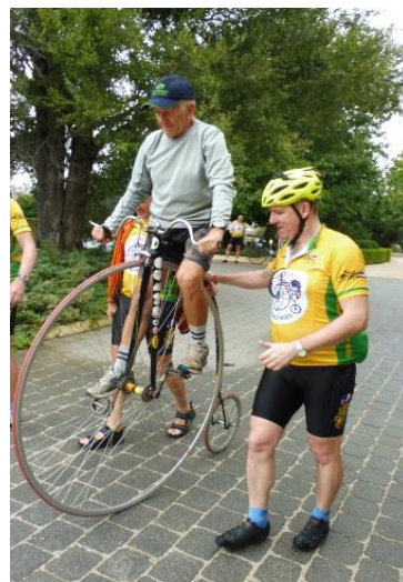
Daleko jsem nedojel.