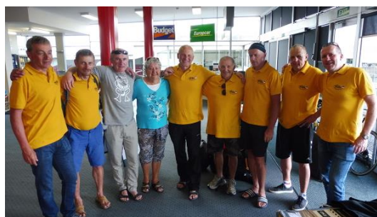
Docela neradi jsme se s nimi loučili

Na tento rok už mají naplánovanou další cyklotouru: