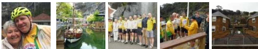
Několik fotek z Penny Royal

Pak znova jeli na kolech do Launcestonu podívat se na Chromého turistickou atrakci "Penny Royal". Celý popis cesty a mnoho pěkných fotografií najdete na http://nakoledetem.cz/akce