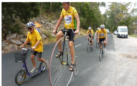
David a Goliáš

vysokém kole a já na koloběžce. Něco jako David a Goliáš! Bylo to od nich moc ohleduplné, že byli ochotni jet za mnou mojí tempem. Naštěstí měli dost času a tak to nebyl problém. Musím se přiznat, že mě bylo líto, že jsme se museli s nimi rozloučit. Jak rád bych se k nim přidal.